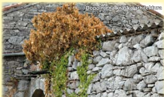
Dopolnjena kraška arhitektura