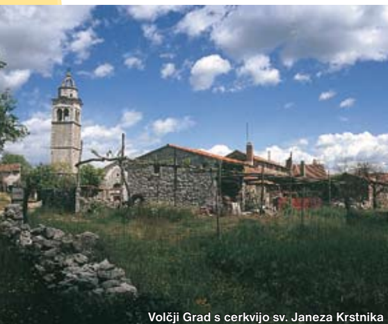
Volčji Grad s cerkvijo sv. Janeza Krstnika