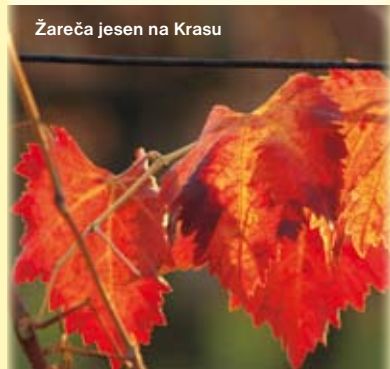
Žareča jesen na Krasu