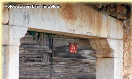
Kolona z verskim simbolom