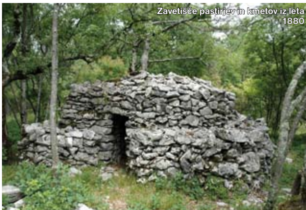
Zavetišče pastirjev in kmetov iz leta 1880