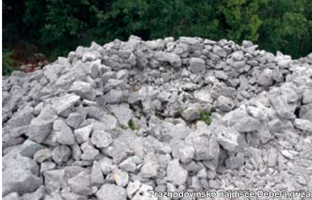
Prazgodovinsko najdišče Debela griža