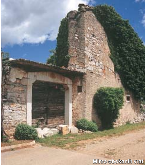
Mimo obokanih vrat