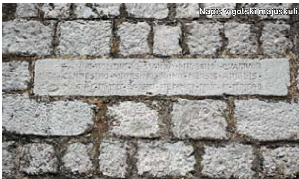
Napis v gotski majuskuli